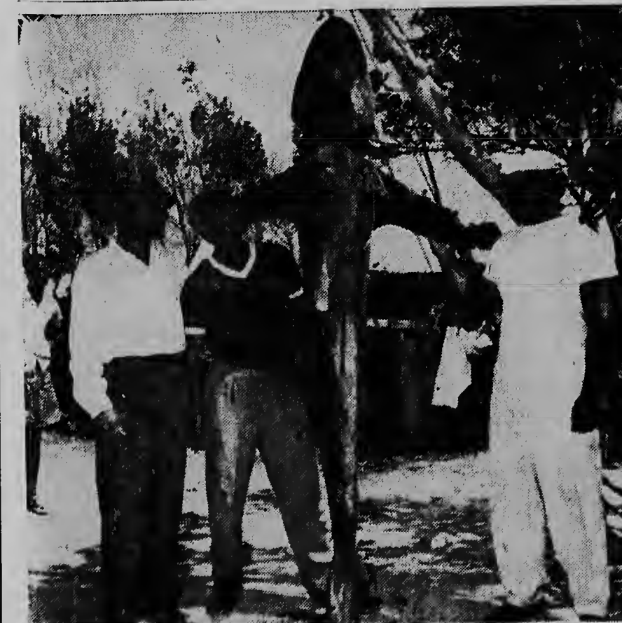
E tres piscadornan d.r.p.d. Medina, Kamperveen y Ras para un poco orgulloso ta contempla nan caza.

E tres piscadornan cu nos ta mira riba e portret aki bou no a laga di hanja palabranan di elogio pa e hazanja aki. E problema ta keda awor ta cual di e tanto interesadonan pa un „plata”, lo hanja e hand'i mei-mei.